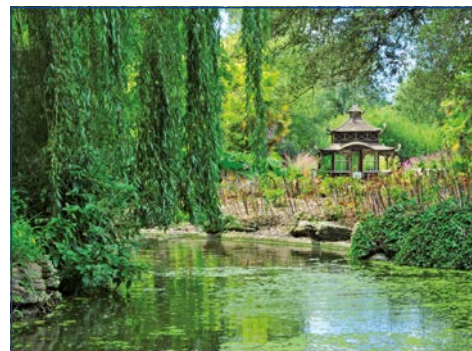
Japanischer Garten im Samares Manor

zur bekannten Glaskirche in Millbrook, deren Innenraum aus farblosem Glas im Stil des Art Nouveau ausgestattet wurde.