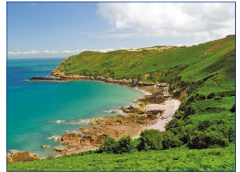
Grün bewachsene Felsküsten

27.05. bis 03.06.2015 • Flug ab/an Frankfurt • ab € 1.049,- p.P. im DZ