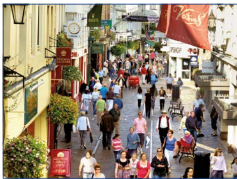
Shopping im charmanten St. Peter Port