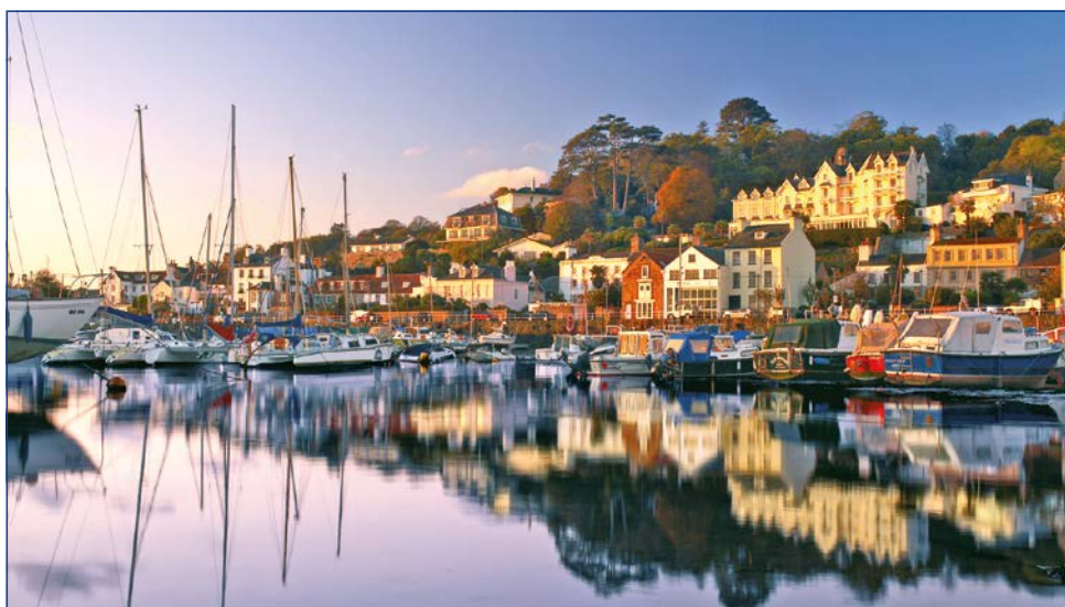
Malerischer Hafen in St. Aubin

Schwester Jersey – abwechslungsreiche Hügellandschaften mit einer vom Klima verwöhnten Vegetation, weiße Sandstrände mit wogendem Dünengras und imposante Steilklippen mit herrlichen Aussichten bezaubern jeden Besucher. Nach der Fährüberfahrt erwartet Sie ein grandioser Anblick: der berühmteste Hafen der Kanalinseln empfängt Sie in Guernseys fantastischer Inselhauptstadt St. Peter Port. Bei einem geführten Stadtrundgang durch die verwinkelten Kopfsteingassen genießen Sie das unverwechselbare Flair des charmannten Städtchens. Am Nachmittag unternehmen Sie eine Inselrundfahrt Richtung Norden - die ungezählten Buchten sind noch genauso malerisch wie 1883, als Auguste Renoir sie in Öl malte. Das Inselinnere besticht durch verträumte Täler, meterhohe grüne Hecken, efeuberankte Steinmauern und wunderschöne Gärten. Dort erwartet Sie „Little Chapel“, die kleinste Kirche der Welt. Sie wurde als Miniaturausgabe der Kirche von Lourdes erbaut und ist mit Muscheln, bunten Porzellanscherben und Kieselsteinen übersät. Nach der Fahrt durch Fort George, wo die Schönen und Reichen wohnen, erreichen Sie wieder St. Peter