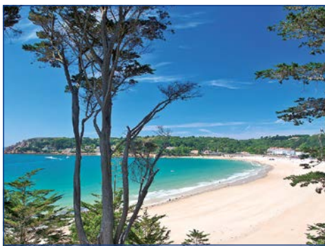
Endloser Sandstrand in der St. Brelade's Bay