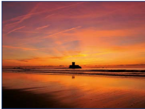
Sonnenuntergang über dem Atlantik