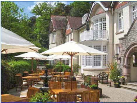
Cream Tea im preisgekrönten „Chateau la Chaire“

Jersey's Wahrzeichen: das majestätische Mont Orgueil Castle