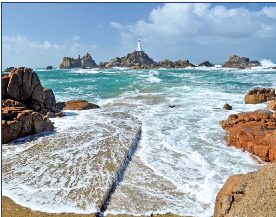
Meeresumspülter Felsenleuchtturm „La Corbière“

A ufgrund der Lage am Golfstrom haben die britischen Kanalinseln ein „Klima, das für den Müßiggang wie geschaffen ist“ (Victor Hugo, 1855). Atemberaubende Küstenabschnitte und entzückende Fischerhäfen verzaubern jeden Besucher. Jersey, die größte der Kanalinseln, hält Englands Sonnenscheinrekord. Kilometerlange Sandstrände, dazwischen romantische Buchten und bunte Blumentepiche, wechseln sich ab mit Palmen und einer üppigen Vegetation im Inselinneren. Zahlreiche Küstenwege laden zu erholsamen Spaziergängen ein. Man kann sich kaum einen besseren Ort vorstellen, um sich in der frischen Meeresluft zu entspannen und vom Alltagstrott zu erholen. Dazu die Wärme und Freundlichkeit der Inselbewohner, die von einer wohltuenden Mischung aus britischer Gemütlichkeit und französischer Lebensfreude geprägt sind – entdecken Sie mit uns dieses ausgefallene Zielgebiet mitten in Europa. Britischer Lifestyle und französisches Savoir-vivre werden Sie noch lange begleiten.