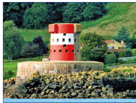
Archirondel Tower: Unterkunft der besonderen Art